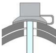
Priveržta ir teisingai apsaugine kepuraitė apsaugota montavimo sistema.